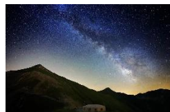
Rifugio del Fargno

Per qualsiasi altra informazione contattare gli accompagnatori.