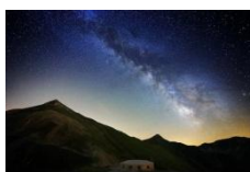
Rifugio del Fargno

Le iscrizioni dovranno pervenire entro e non oltre il 22/03/2020 e saranno valide dietro versamento della caparra di Euro 25,00. Per qualsiasi altra informazione contattare gli accompagnatori.