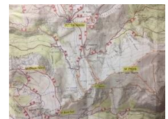
Carta: Monti Sibillini

Sentieri: 313 – 277 – 273 – 274 Sentieri privi di segnaletica: 25 – 19 – 18